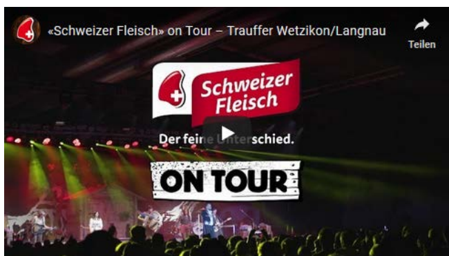
«Schweizer Fleisch» on Tour

Bisher wurden insgesamt 13 «Schweizer Fleisch»-on-Tour-Beiträge realisiert. Unter anderem: